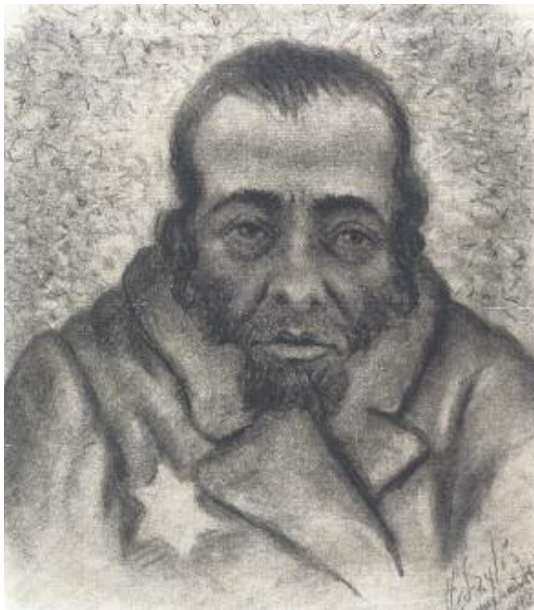
Έδρα Ιωσήφ και Εσθήρ Γκανί

Ζβι Hirsch Szyllis (1909-1987), Κάτοικος του γκέτο με το άστρο του Δαβίδ , γκέτο Lodz, 1942, κάρβουνο σε χαρτί.