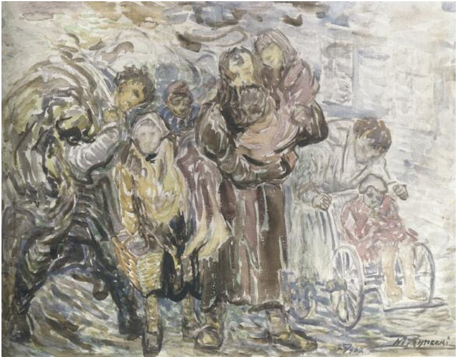
Έθνος Ιωσήφ και Εοδήρ Γκανί

Mosche Rynecki (1881-1943), Πρόσφυγες , Βαρσοβία, 1939, υδατογραφία σε χαρτί.