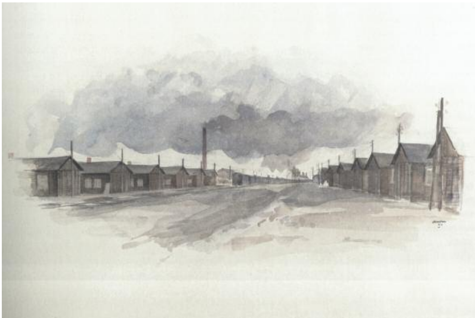
Έργο Τσοφ και Εοθέρ Γκάνι

Leo Kok (1923-1945), Λεωφόρος της δυστυχίας , στρατόπεδο Westerbock, 1944, υδατογραφία και μολύβι σε χαρτί.