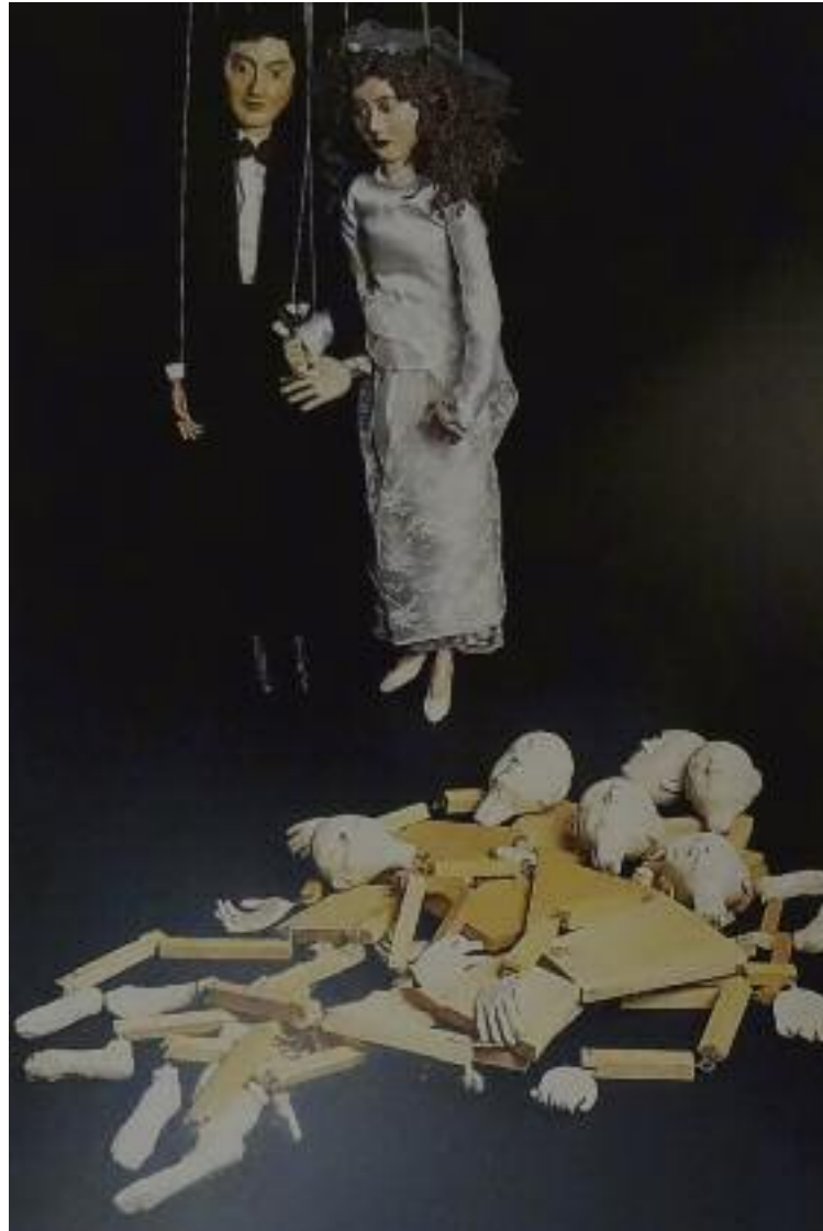
Έργο Ιωσήφ και Εσθήρ Γκανί

Άρτεμις Αλκαλάη (γ. 1957), Γι' αυτούς που έζησαν μαζί γι' αυτούς που πέθαναν μαζί, 1997, μικτή τεχνική.