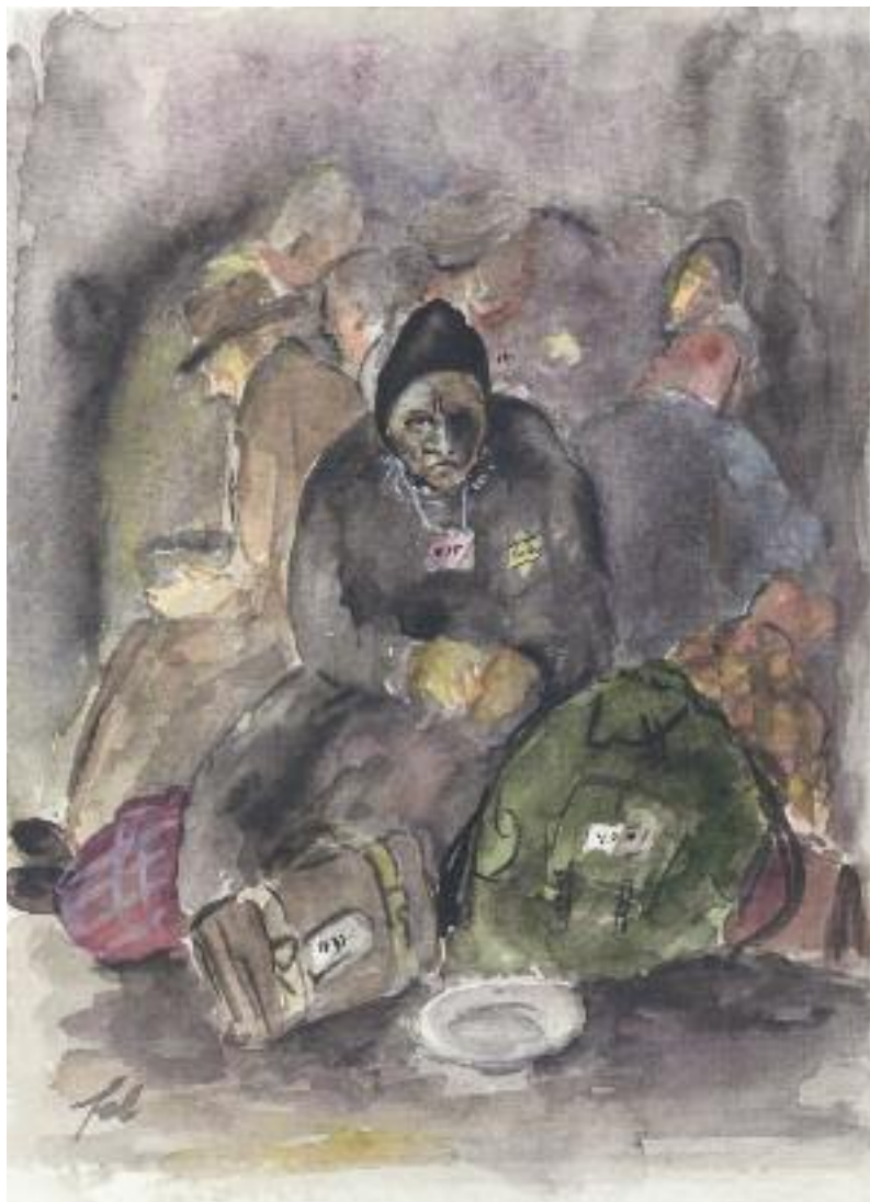
Θύμα Ιωσήφ και Εσθήρ Γρανί

Felix (Ferdinand) Bloch (1898-1944), Η άφιξη της μεταγωγής , γκέτο Theresienstadt, 1942-44, υδατογραφία και ινδική μελάνη σε χαρτί.