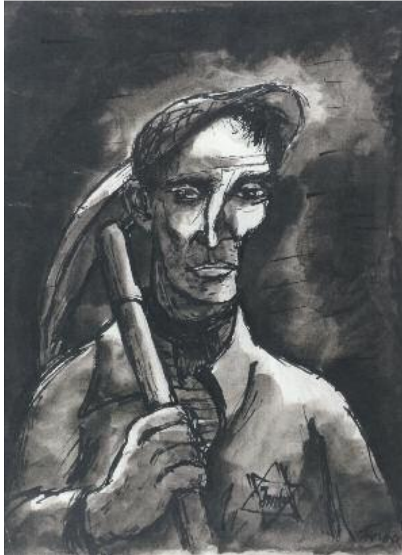
Έργο Ιωσήφ και Εσθήρ Γκανί

Bedřich Fritta (Friedrich Taussing) (1906-1944), Εβραίος εργάτης (αυτοπροσωπογραφία) , γκέτο Theresienstadt, 1941-44, ινδική μελάνη, υδατόχρωμα και μολύβι σε χαρτί.