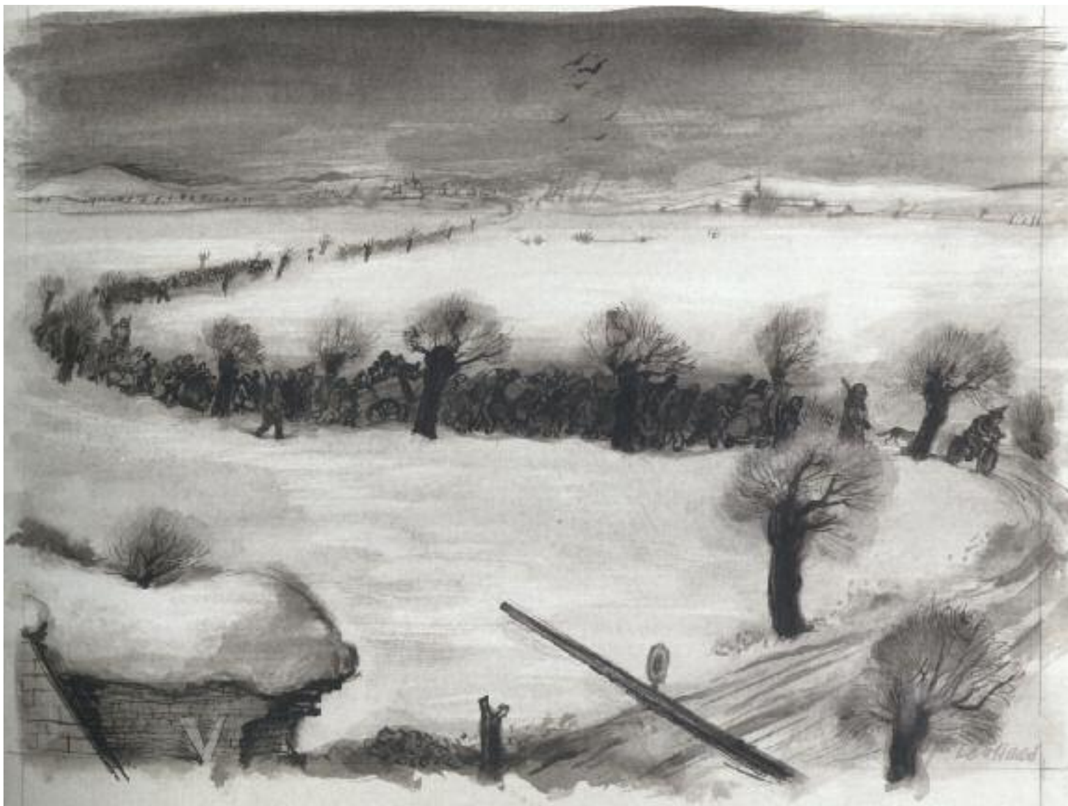
Ψηφισμα Τσιούφ και Εσθέρ Γκράνι

Leo (Lev) Haas (1901-1983), Άφιξη της μεταγωγής , γκέτο Theresienstadt ,1942, ινδική μελάνη και υδατόχρωμα σε χαρτί.