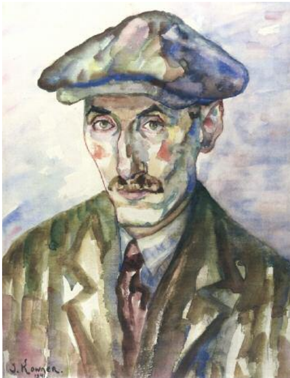
Έργο Τζωίφ και Εσθέρ Γκανί

Joseph Kowner (1895-1967), Αυτοπροσωπογραφία , γκέτο Lodz, 1941, υδατογραφία σε χαρτί.