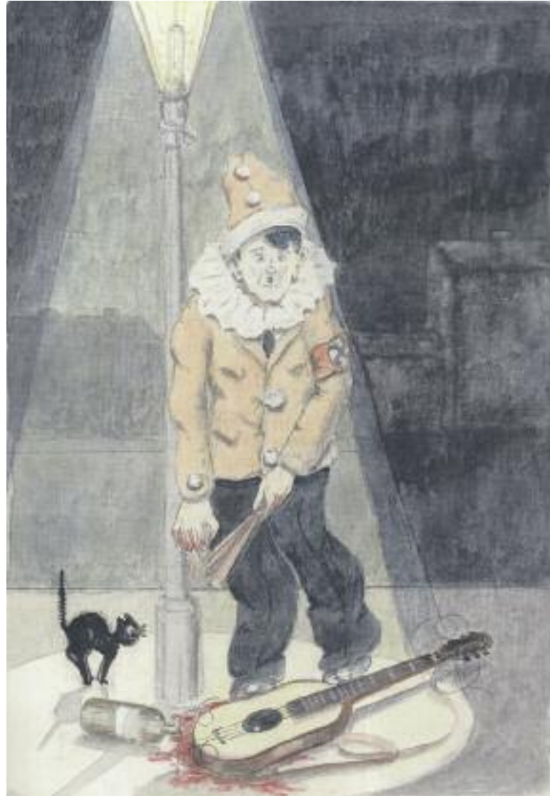
Έργο Ιωσήφ και Εσθέρ Γκανί

Pavel Fantl (1903-1945), Το τραγούδι τελείωσε , γκέτο Theresienstadt, 1942-44, υδατογραφία και ινδική μελάνη σε χαρτί.