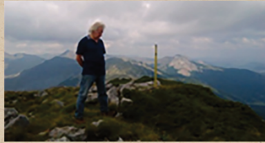
Ανάβαση 18 Αυγούστου 2018.