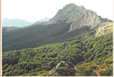
Πάνω Αρένα. 2.196 υψόμετρο. Ανάβαση 18 Αυγούστου 2018.

του χωριού μας 190 αυτοαμυνίτες. Σε μια βδομάδα λιποτάκτησαν. Μείναμε: ο οπλισμένος πατέρας.