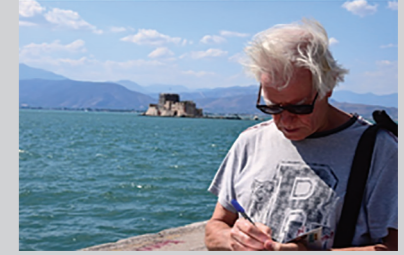
ΦΩΤΟ ΣΠ. ΝΑΟΥΠΛΟ

1-η Μαρτίου 1930. Γεννήθηκα. 1946 τελείωσα την 6 η 8/ταξίου στα Γρεβενά. 1947-1949 αντάρτης του ΔΣΕ στο Γράμο. Ανθυπολοχαγός. 1949-1976 πολιτικός πρόσφυγας στην ΕΣΣΔ. Τελείωσα: Σχολή Αξιωματικών με άριστα. Με το βαθμό του υπολοχαγού. Φιλολογική Σχολή πανεπιστημίου με διάκριση ανάμεσα στους αριστούχους. Φοιτητής δημοσίευσα περί τις 40 εργασίες για Έλληνες ποιητές και πεζογράφους. Εκπόνηση διδακτορικού (Η ζωή και το έργο του Σολωμού) στο Ινστιτούτο Παγκόσμιας Φιλολογίας (Ακαδημία Επιστημών της ΕΣΣΔ) στη Μόσχα. Μόνιμος επιστημονικός συνεργάτης. Για πρώτη φορά εκδίδονται στα Ρωσικά «Ο Χριστός Ξανασταυρώνεται» και ο «Καπετάν Μιχάλης» του Καζαντζάκη. Δική μου μετάφραση και πρόλογος. Με δική μου επιμέλεια (επιλογή, κατά λέξη μετάφραση και πρόλογο) εκδίδονται για πρώτη φορά στα Ρωσικά συλλογές ποιημάτων του Σολωμού και του Παλαμά. Οι μονογραφίες μου «Η λογοτεχνία της Ελληνικής Αντίστασης» (1968) και «Η ελληνική λογοτεχνία 1900-1967» (1973) είναι οι πρώτες στην ιστορία της Ρωσίας.