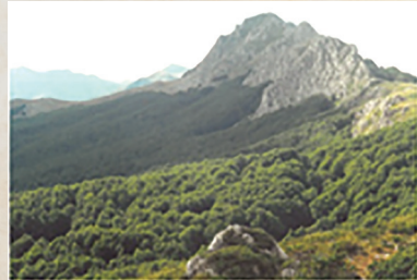
Πάνω Αρένα. 2.196 υψόμετρο. Ανάβαση 18 Αυγούστου 2018.

1947. Μάης. Επιχειρήσεις στρατού. Το αρχηγείο Χασίων άφησε τον πατέρα μου στην περιοχή για να κρατήσει στα δάση του χωριού μας 190 αυτοαμυνίτες. Σε μια βδομάδα λιποτάκτησαν. Μείναμε: ο οπλισμένος πατέρας.