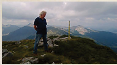
Ανάβαση 18 Αυγούστου 2018.