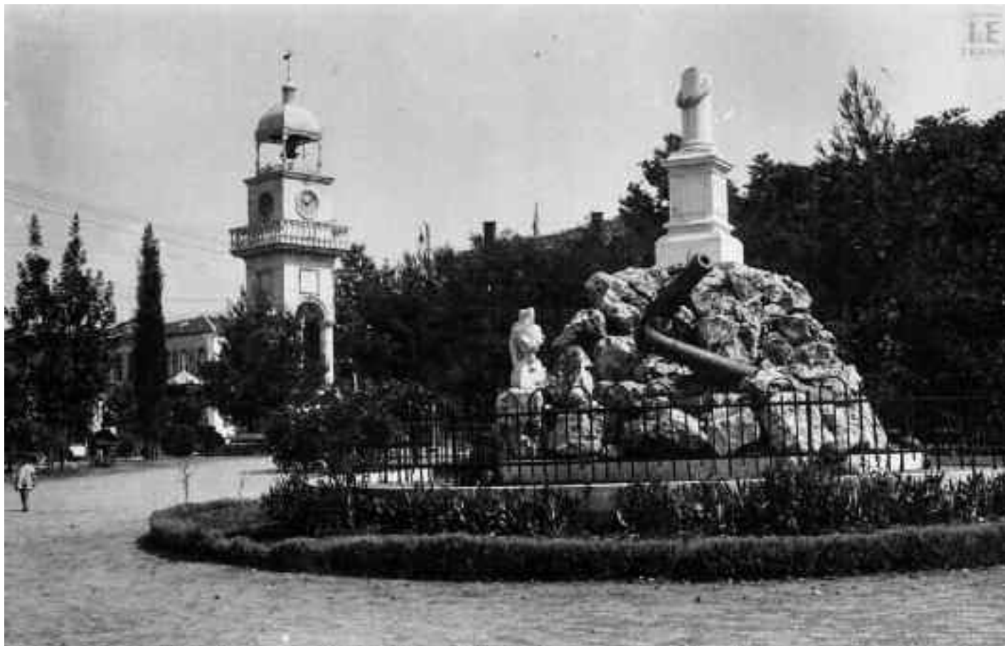
Το Ηρώο Μπιζανομάχων. Το 1960 περίπου έφυγε το «Ηρώον Μπιζανομάχων» και στην θέση του Ηρώου τοποθετήθηκε το άγαλμα της «Υπερφάνου και πονούσας Ελλάδος». (Γλυπτό του Β. Φαληρέα). Η αρχική του θέση ήταν στην Άνω Πλατεία πάνω από το παλιό Δημαρχείο.