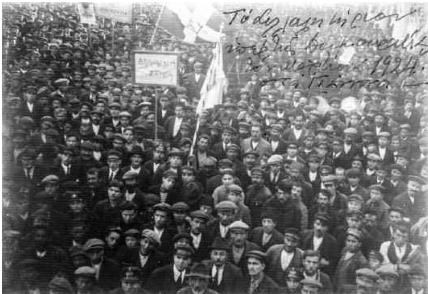
Το συλλαλητήριο ὑπὲρ τῆς Δημοκρατίας τὸν Μάρτιον 1924 στὰ Γιάννινα.