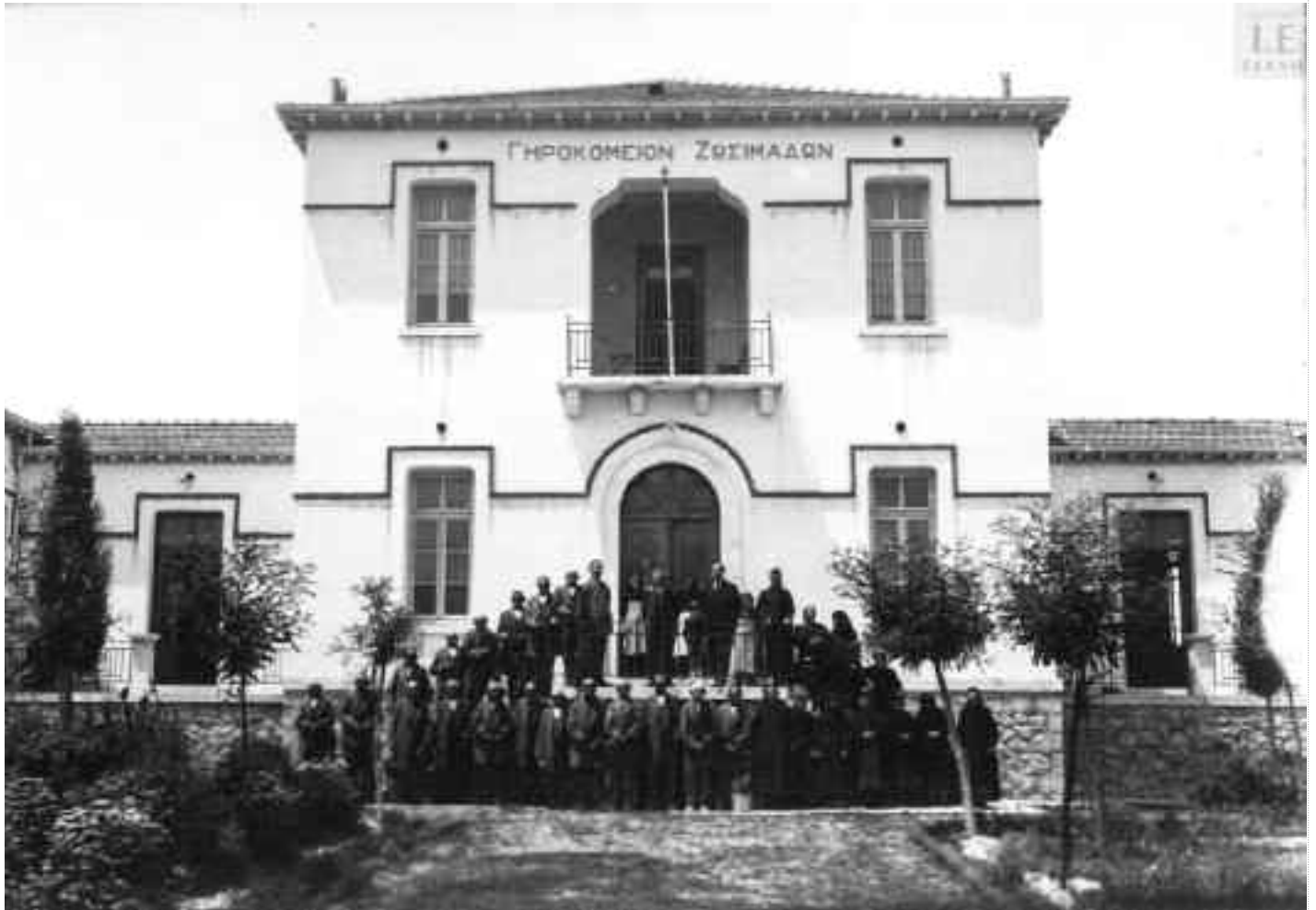
Το Γηροκομείο Ζωσιμάδων (συννοικία Λακκιωμάτων). Τα εγκαίνια του Γηροκομείου έγιναν το 1929.