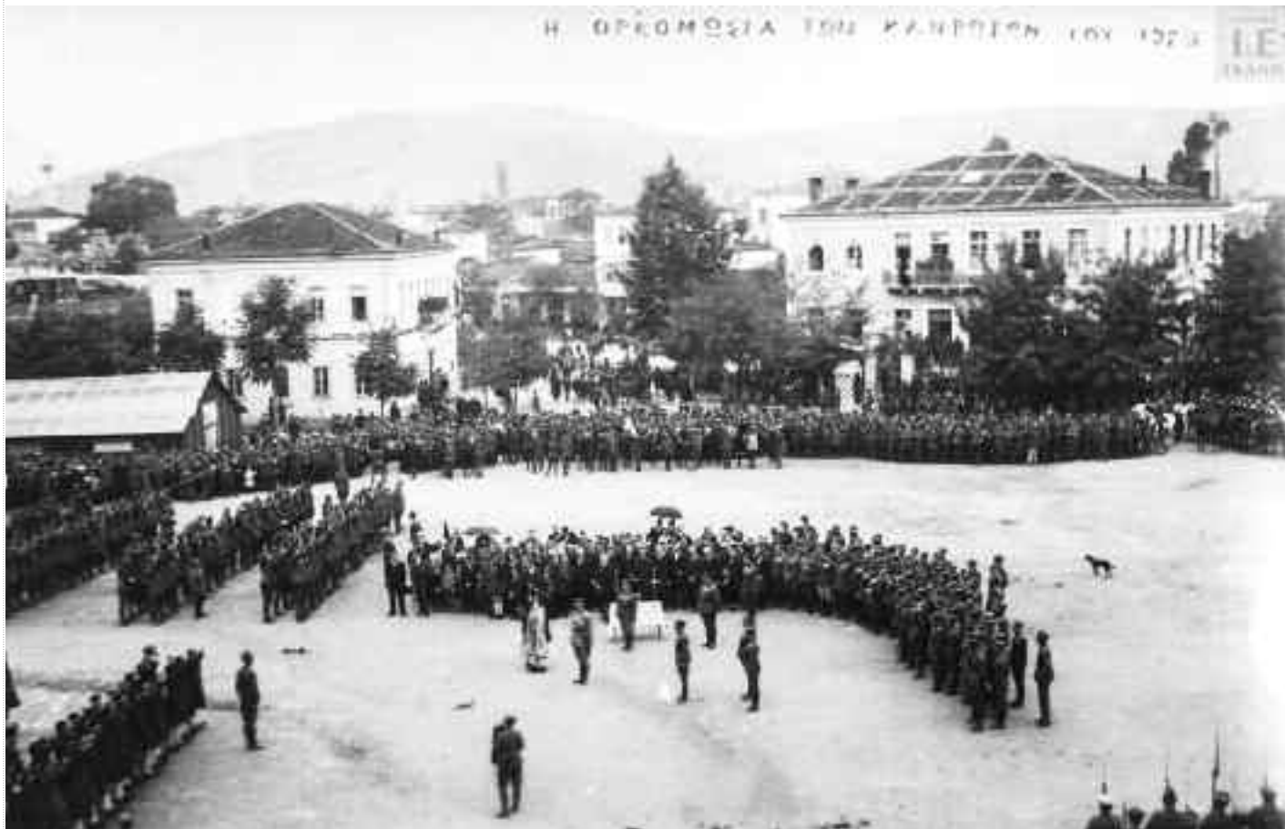
Η ορκωμοσία των κληρωτών του 15ο Τάγματος Πεζικού της VIII Μεραρχία Ηπείρου στην πλατεία Ομοιοίας (Λιθαρίσια).