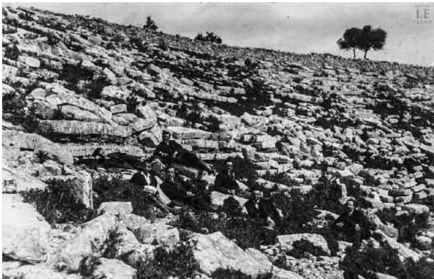
Δωδώνη. Δεκαετία 1920.