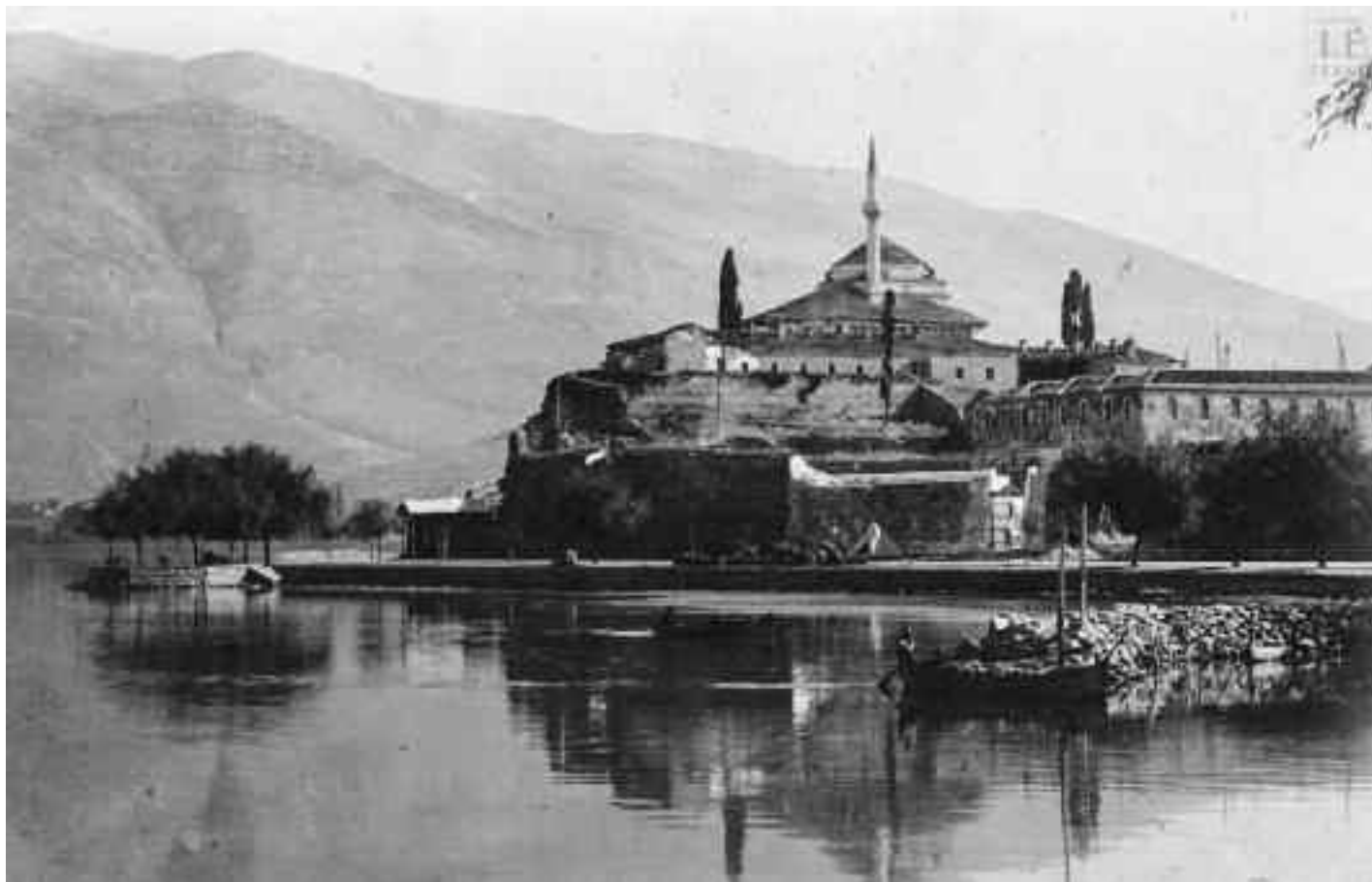
Το τζαμί του Ασλάν Πασά. Το τζαμί ανηγέρθηκε από τον Ασλάν Πασά Α΄, Βαλή Ιωαννίνων (1600 – 1618 ή 1620) προς τα Β. του Κάστρου στη θέση όπου ήταν το Μοναστήρι του Αγίου Ιωάννη του Προδρόμου.