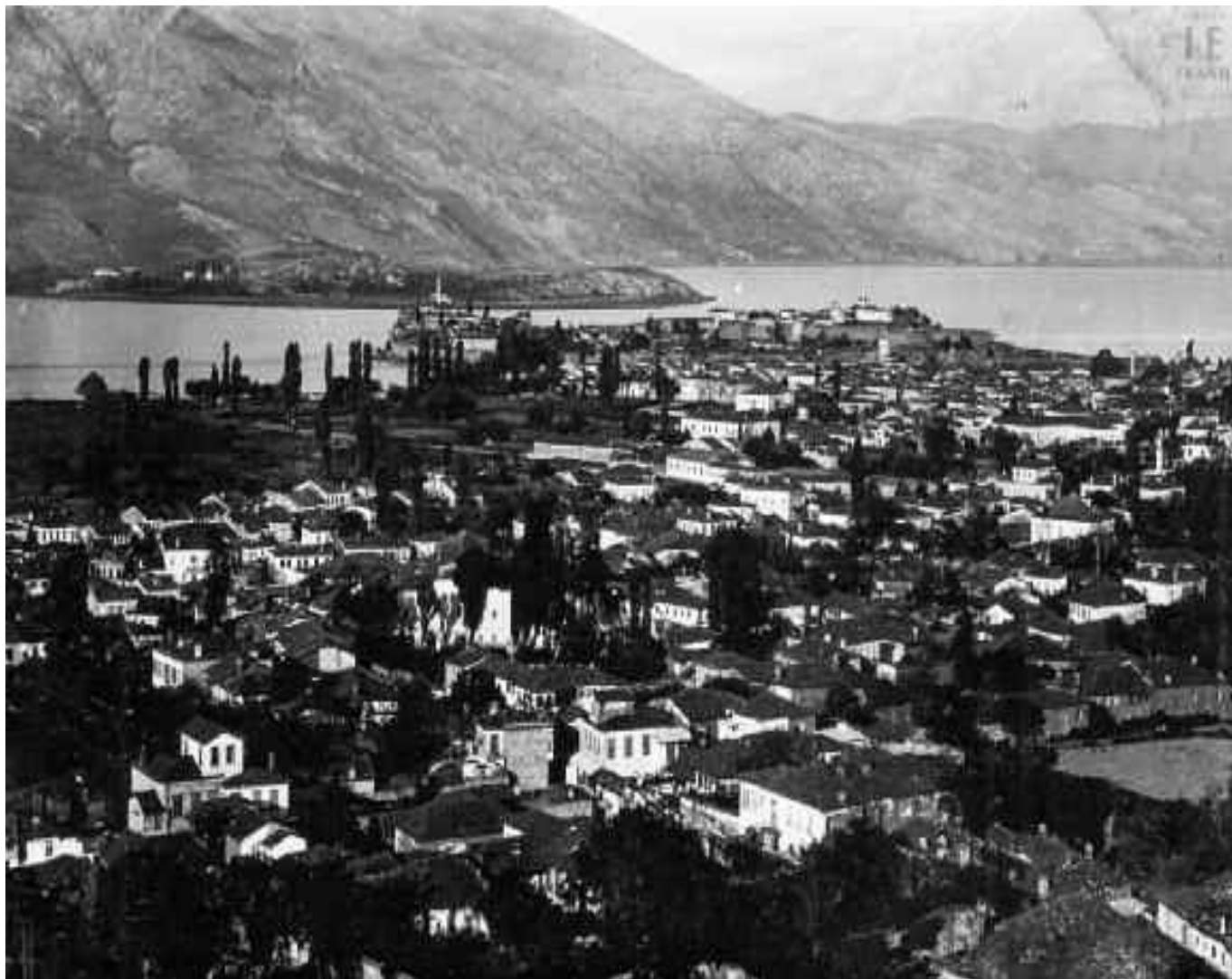
Γιάννινα, δεκαετία 1920.

Τα παλιά Γιάννινα με το βλέμμα ενός νέου: οι φωτογραφίες του Πέτρου Ζωνίδα