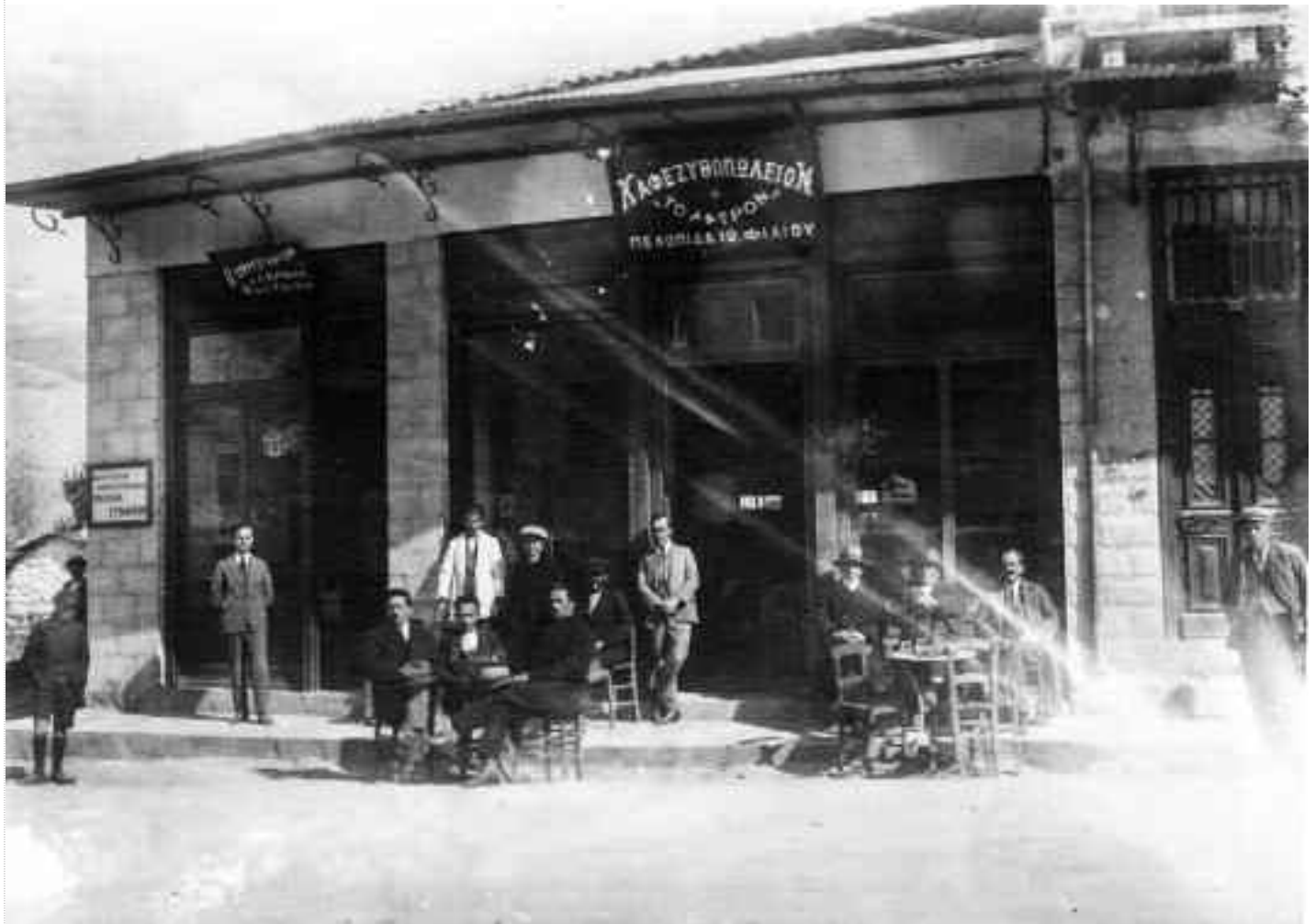
Καφεζυθοπωλείον «ΤΟ ΑΣΤΡΟΝ» Πελοπίδα Ιω. Φίλιου. Αριστερά το κομμωτήριο «Ο ΚΡΙΝΟΣ» Φωτ. Τσίτου. Δεξιά όμορφη ξύλινη πόρτα - είσοδος οικίας.