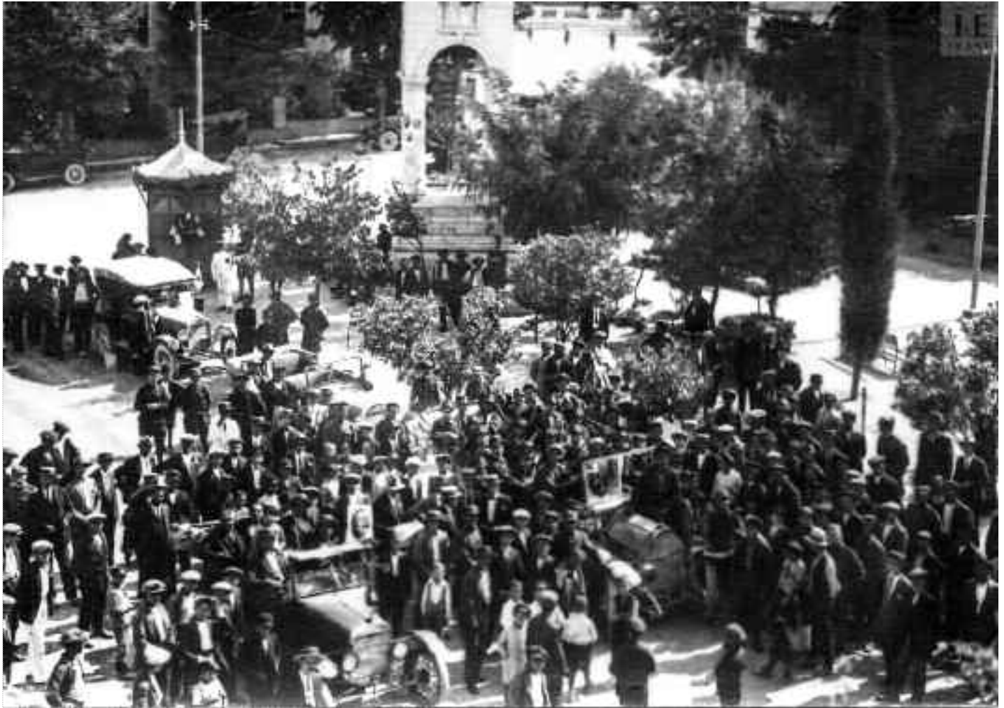
Διαδήλωση στην Κεντρική Πλατεία. Μπροστά αριστερά η φωτογραφία του Ελευθερίου Βενιζέλου.