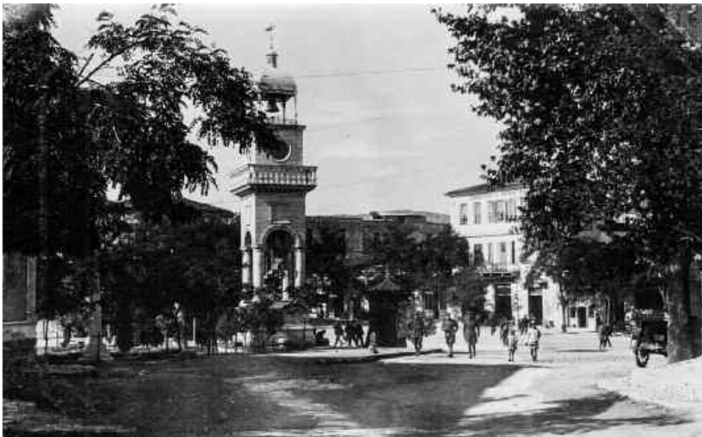
Το Ωρολόγι της Κεντρικής Πλατείας.

«...Ανηγέρθηκε το 1905 με την ευκαιρία των Ιωβηλαίων του Σουλτάν Αμπντούλ Χαμίτ, σαν δώρο των Γιαννίνων προς τον υψηλόν Πατισάχ, με την προτροπή του Οσμάν Πασιά, του καλού και δικαίου, που εννοούσε το Μιλιέτ των Ρωμιών, φυσικά και για λόγους πολιτικής σκοπιμότητας, έναντι των Ρουμάνων και των Αλβανών. (Βλ. Οσμάν Πασιάς)... Η αρχική θέση του ήταν στο Κέντρο της πλατείας, μπροστά στο Ξενοδοχείο «Αβέρωφ» του Ιχσάν Εφέντη... Κατά τις εορτές της Νίκης των συμμάχων (Αντάντ) το 1918 την ώρα της παρελάσεως στην πλατεία του Πυροβολικού μας, ο τροχός ενός κανονιού προσέκρουσε στο σιδερένιο κιγκλίδωμα του Ωρολογιού και το έριξε κάτω. Εξοργισμένος από το γεγονός αυτό ο τότε Γεν. Διοικητής Ηπείρου, ο γνωστός μετέπειτα Αρμυστής Σμύρνης, Αρ. Στεργιάδης διέταξε το Δήμαρχο Ιωαννίδη να μεταφερθεί το Ωρολόγι το ταχύτερο σε άλλο σημείο...» (Κώστα Φωτόπουλου: Τα Γιάννινα Οι μαχαλάδες, τα σοκάκια και τα τοπωνύμιά τους με τις Ιστορικές και λαογραφικές παραδόσεις και ανέκδοτα. Βιβλιοθήκη Ηπειρωτικής Εταιρείας Αθηνών Αριθ.57 σ.94).