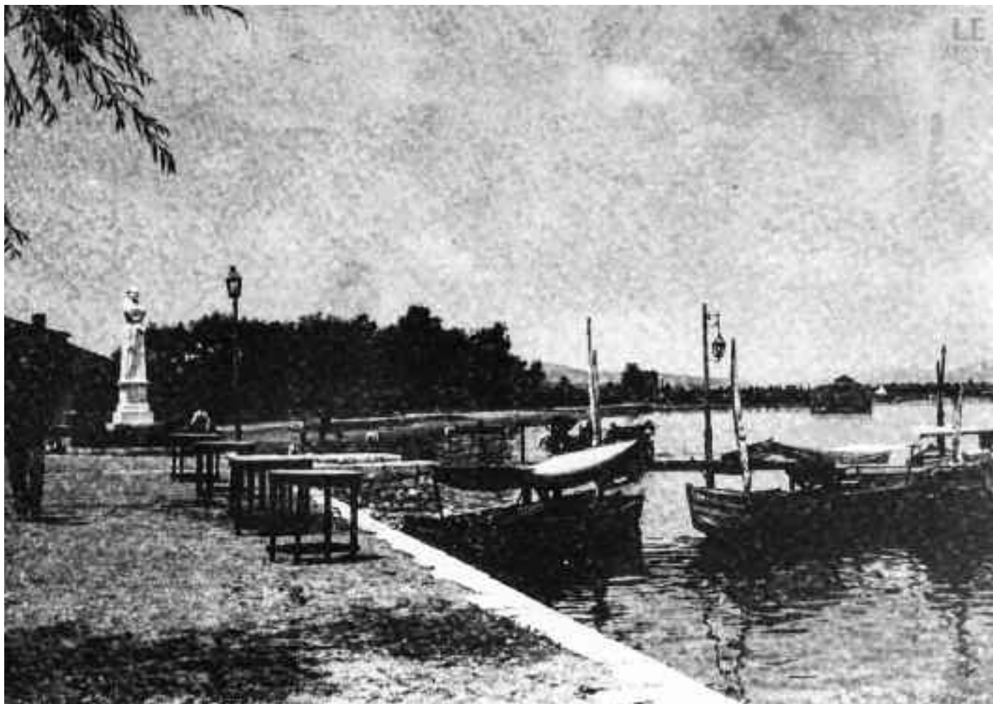
Η Πλατεία Μαβίλη.