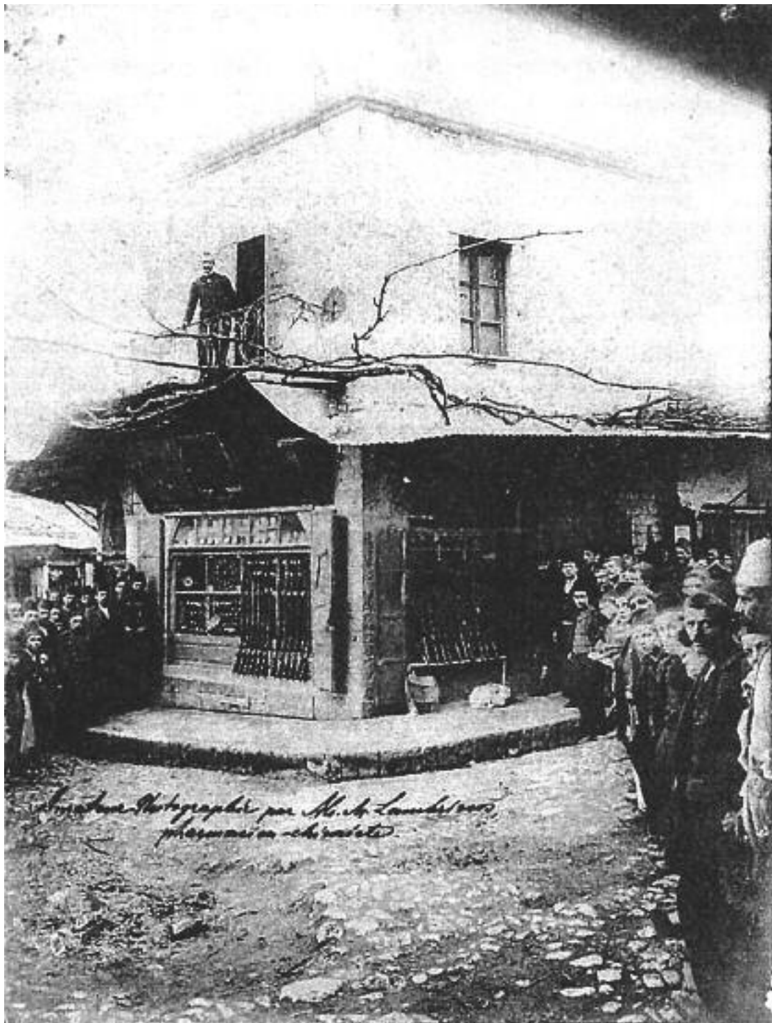
Το Ρολογάτικο Κιούρη στο Κριθαροπάζαρο στην συμβολή των οδών Κάνιγγος και Τσιριγώτη. Μια σπάνια ίσως φωτογραφία του μεγάλου Γιαννιώτη φωτογράφου – φαρμακοποιού Αλκ. Λαμπρινού έτος 1899.