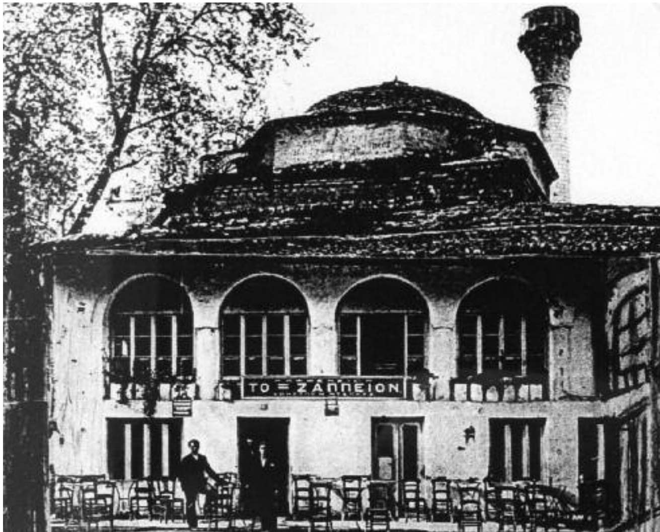
«Το μικρό Ζάππειον» από το 1913 μέχρι το 1934 και μετά «Το Τζαμί» στο τζαμί Καλούτσιανης. Στη φωτογραφία το 1937 στην πόρτα ο Χάρης Καλαντζής ιδιοκτήτης με τον αδελφό του Βασίλη Καλαντζή. Ανοικτό μέχρι το 1970.