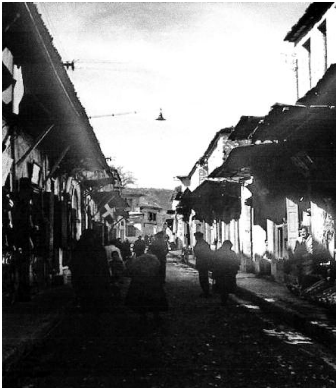
Η οδός Τσιριγώτη το 1952.