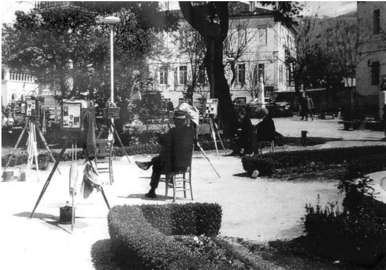
Μια σπάνια φωτογραφία του 1960 ίσως η τελευταία φορά που είναι μαζί όλοι σχεδόν οι φωτογράφοι, πέντε τον αριθμό, της πλατείας Ελευθερίας της πόλης μας. (Αρχείο Κ. Κωστούλα).