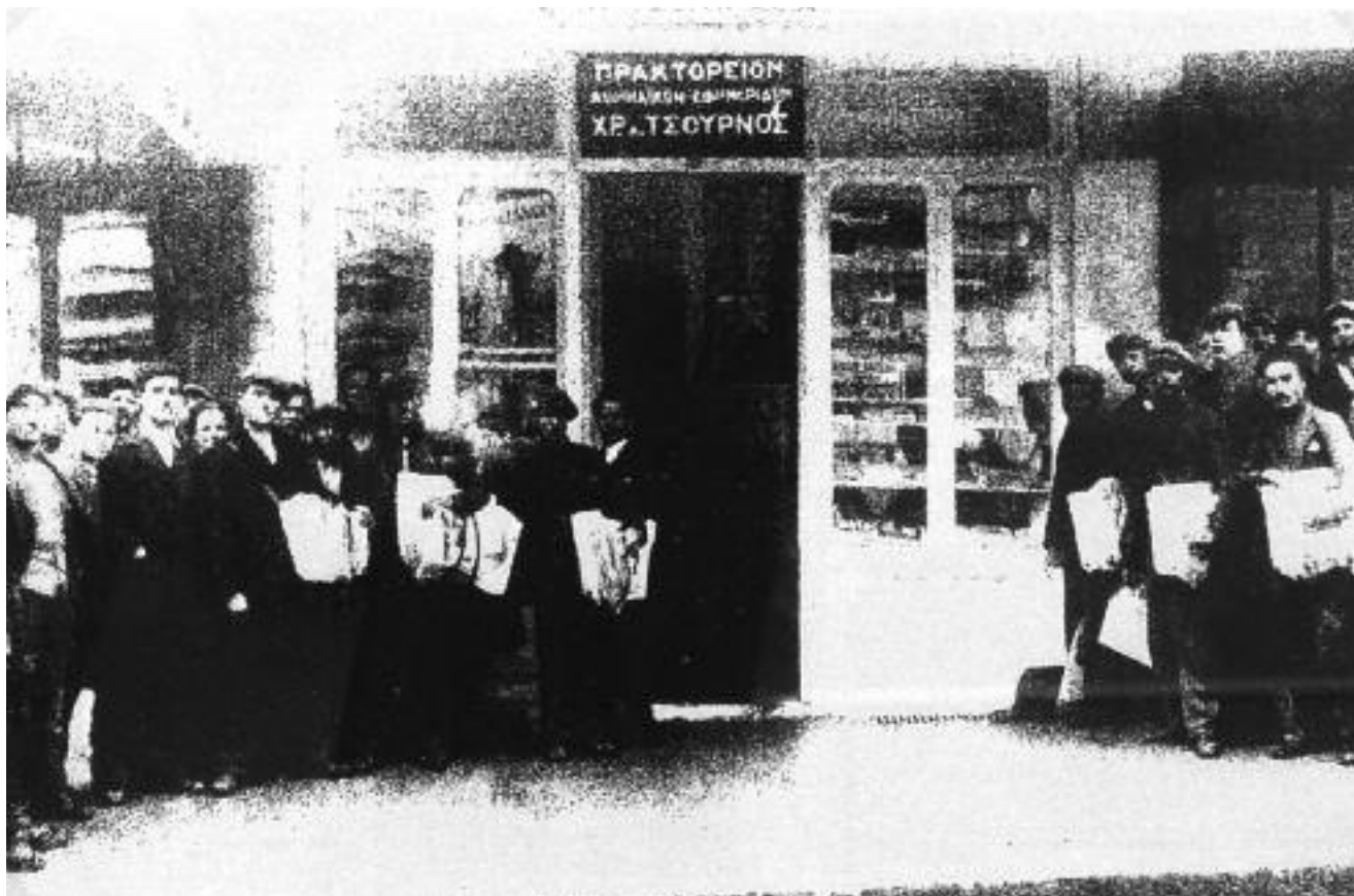
Στην φωτογραφία όλοι οι εφημεριδοπώλες της πόλης στο πρακτορείο εφημερίδων του Χρ. Τσούρνονο το 1930 στο ξενοδοχείο Ίλιον (:). Φωτογραφία του Γ. Πανταζίδη στο βιβλίο του Κ. Κωστούλα «Επιχειρηματικές διαδρομές στα προπολεμικά Γιάννινα».