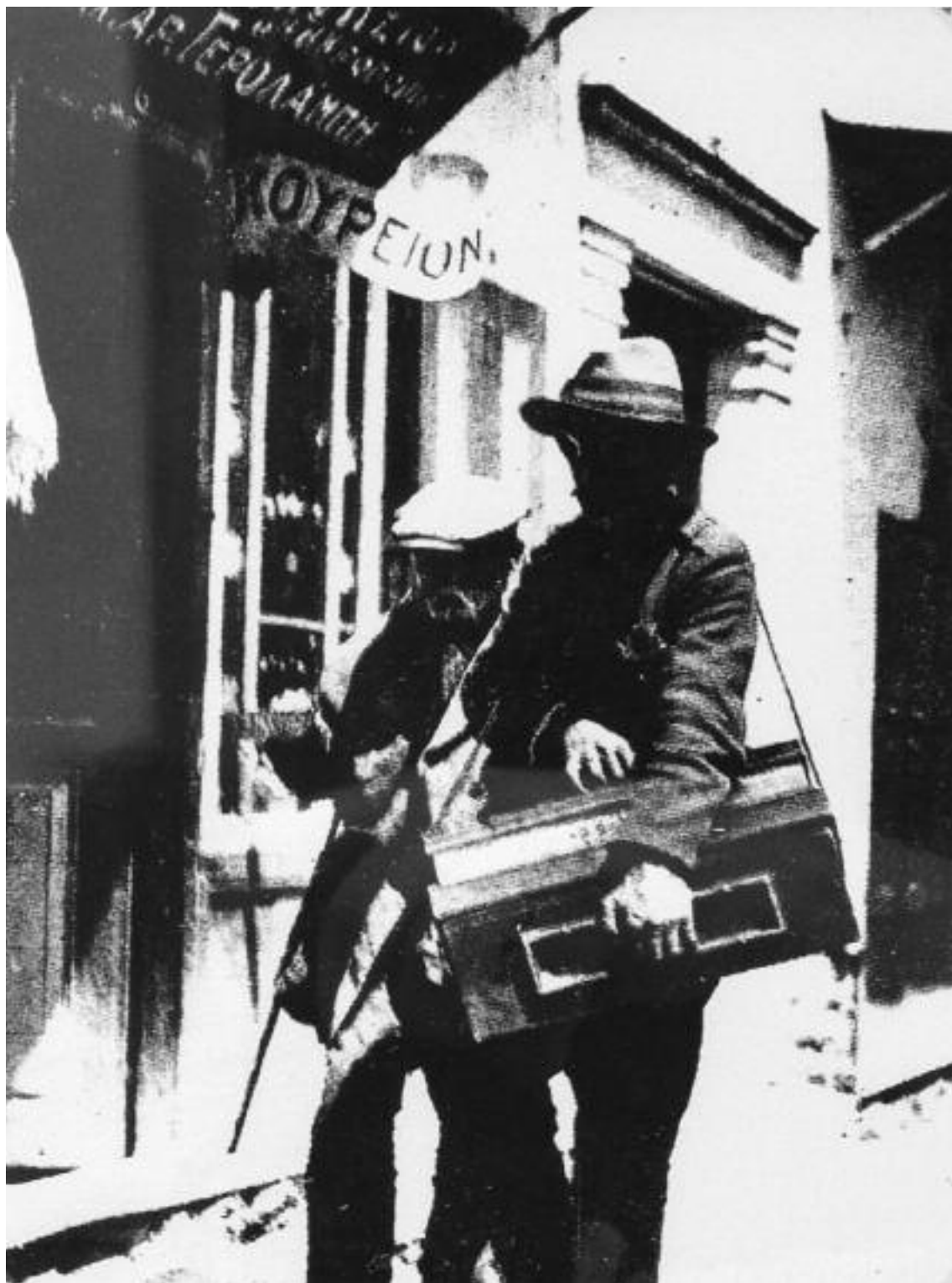
Ο Βασ. Κουτσαβέλης φωτογράφησε σε κεντρικό δρόμο της πόλης το 1938 δύο τυφλούς ζητιάνους.