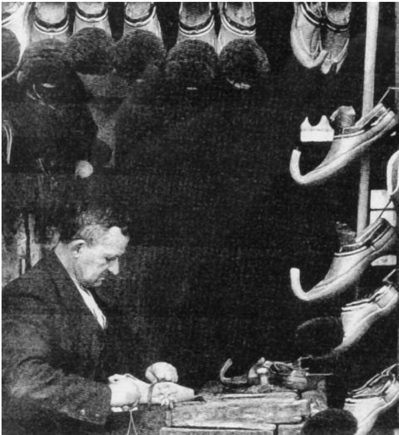
Οι Τσαρουχάδες στα παλιά Γιάννενα καταγόταν από το Συρράκο, Μέτσοβο, Καλαρρύτες και είχαν τα μαγαζιά τους κοντά στο μπεζεστένι. Ο εικονιζόμενος τσαρουχάς άγνωστος.